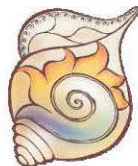
NVO «Nova šansa u Novom»